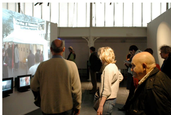
« Paroles et Mémoires des quartiers populaires », exposition de Canal Marches à la Maison des métallos, avril 2009